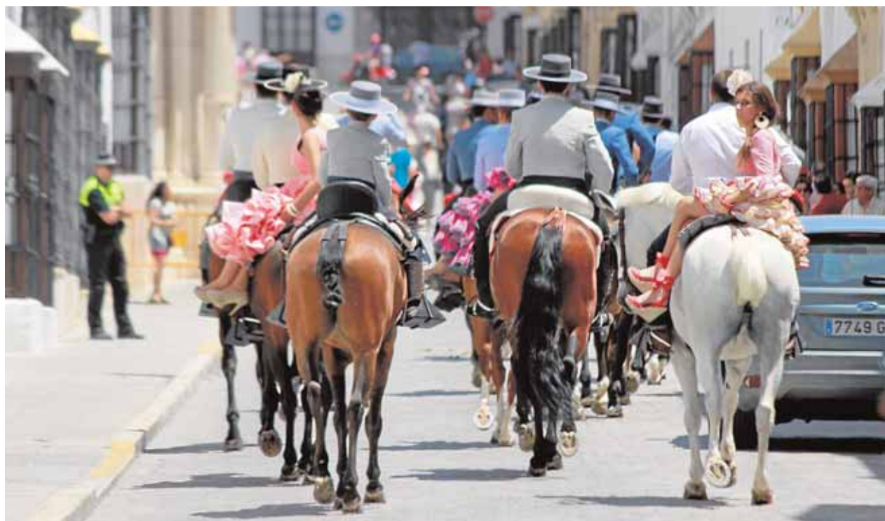
Caballistas a su llegada a la Calle San Pedro, en Osuna

Si el papel de los toros es importante no lo es menos el del caballo. Un gran número de vecinos vive con pasión el mundo del toreo y el del arte ecuestre. A la ya famosa concentración de caballistas habría que sumar diferentes espectáculos con caballos y de doma vaquera. Sin duda de visita obligada. No en vano la Feria de Mayo de Osuna fue reconocida por su importancia como de Interés Turístico de Andalucía.