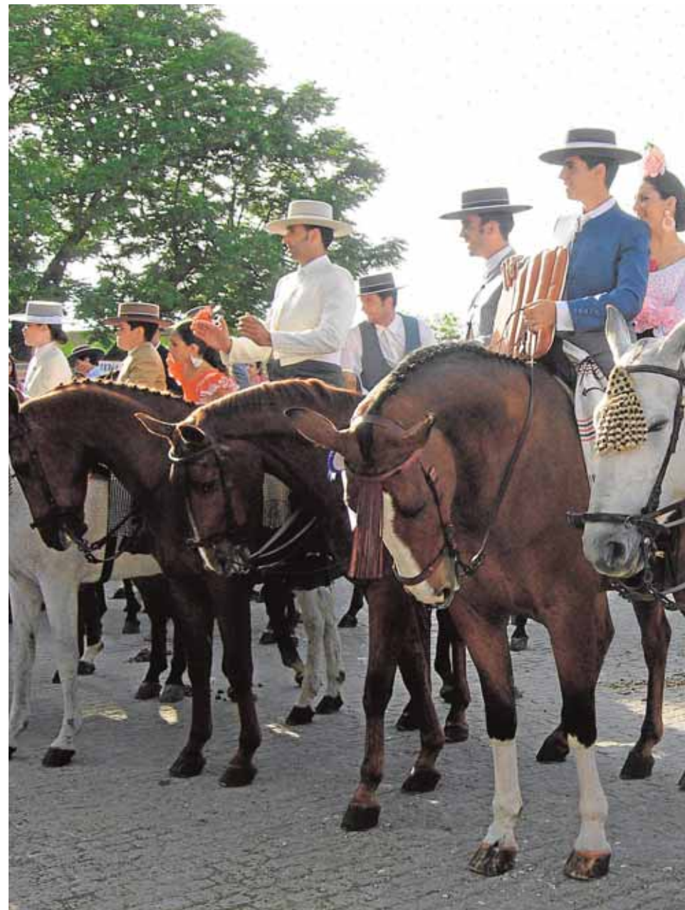
La gran afición que existe en Carmona al caballo sirve estos días para engrandecer la

Para acudir a la Feria de Carmona hay algunas nociones que es bueno saber. La costumbre es acudir más bien tarde. La Feria comienza a llenarse a partir de las tres de la tarde. Lo más habitual una vez que se está en el Real de la Feria es no retirarse y estar hasta