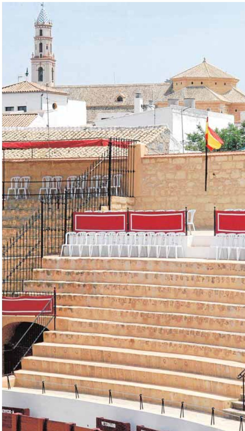
La plaza de toros de Osuna es una referencia en la provincia

Los más pequeños disfrutaron ayer del «día del niño» y aprovecharon hasta el último minuto para subir a las atracciones a mitad de precio. Pero la Feria de Mayo guarda un día para todos los gustos. Hoy es el turno de las personas mayores y su tradicional almuerzo en la caseta municipal con la actuación del coro del Centro de participación activa «El chorrillo del agua». El viernes llega uno de los momentos más esperados con el paseo de caba-