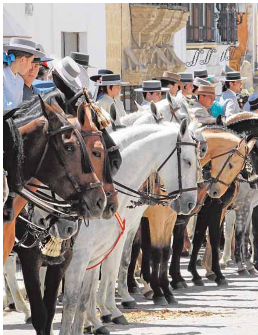
Caballistas en la calle San Pedro de Osuna