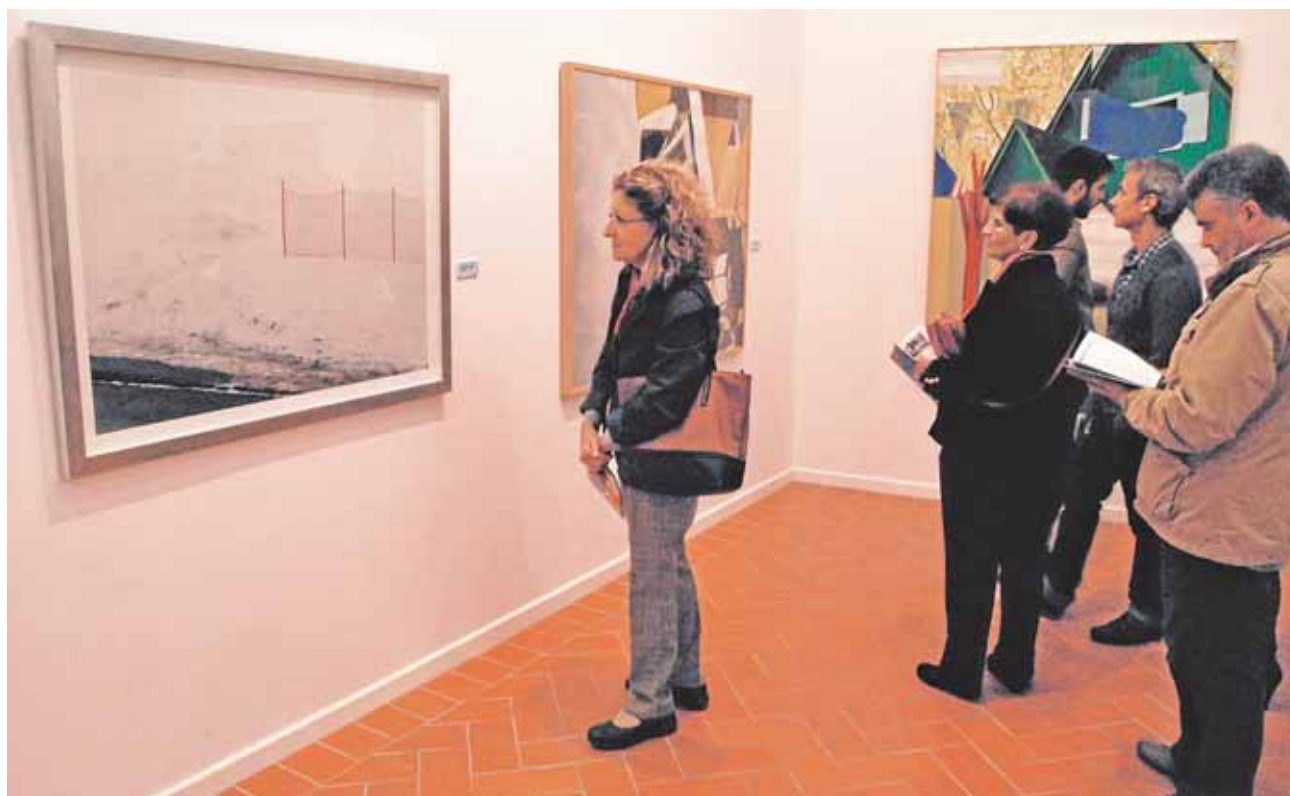
La exposición del certamen de arte contemporáneo estará abierta al público hasta el 31 de mayo

drid un premio por su vino tinto Bemoles 2013. El galardón, medalla de Plata, fue concedido por el prestigioso grupo CINVE, y está encuadrado en la categoría de «vinos tranquilos». Este vino es comercializado en España, Inglaterra y Alemania. F.R.M..