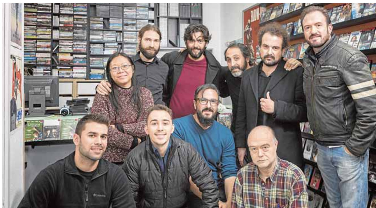
El equipo responsable del corto durante el rodaje en el videoclub «Ficciones» de Madrid

quedado el noveno en la clasificación, con 42 puntos, contando con 52 goles en su haber frente a los 45 en contra. Aún les queda un encuentro, será amistoso ante el Real Betis juvenil de Liga Nacional el próximo 23 de mayo.