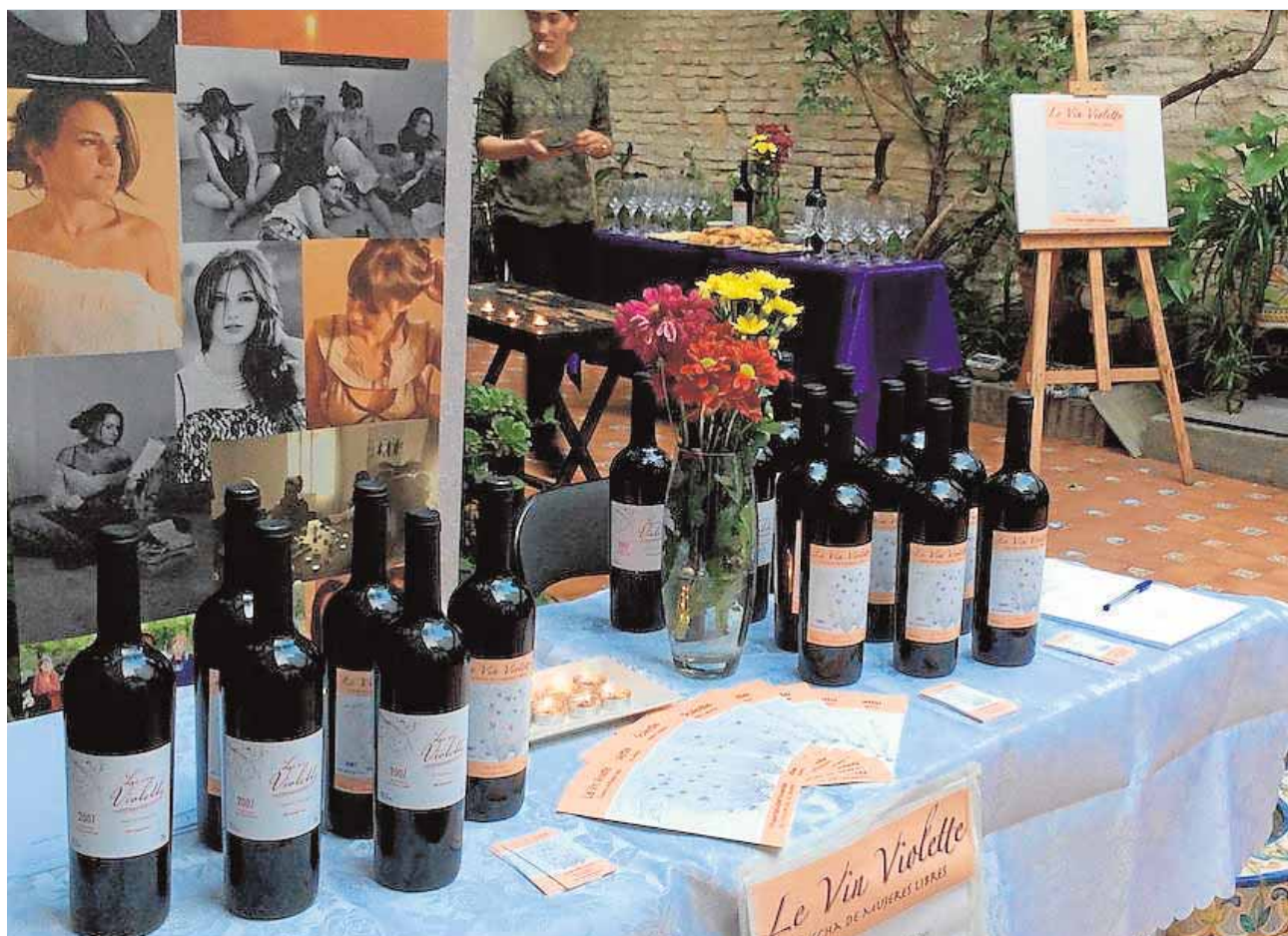
El pasado 29 de abril «Le Vin Violette» fue presentado en la sede sevillana de la asociación La Imprenta A.C.

actos comenzarán mañana viernes con una misa en la que se llevará a cabo la ofrenda de flores y la bendición de las medallas. El sábado se concentrarán las carretas y caballistas para hacer el camino hasta la Ribera del Cala. A.C.