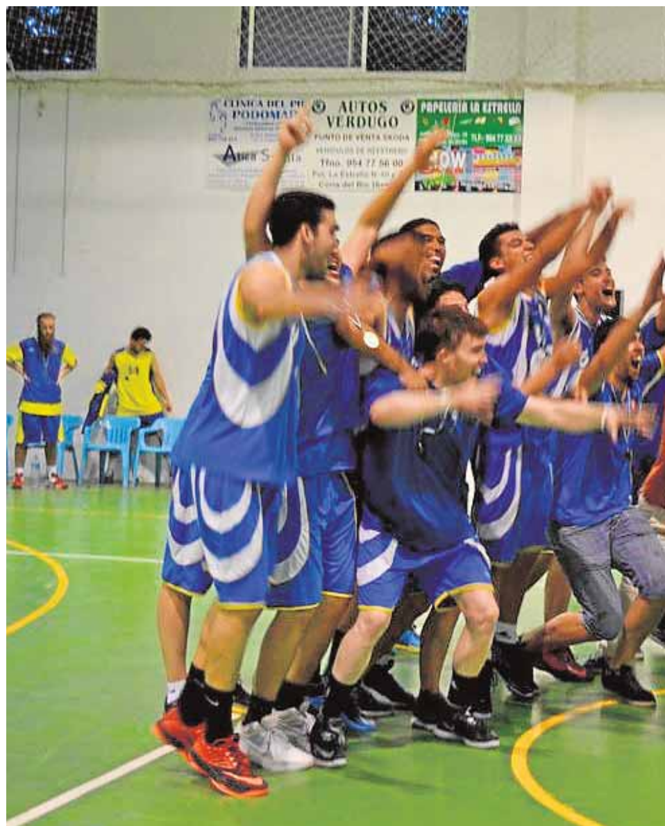
Los jugadores del Club Baloncesto Olivares han ascendido a Primera División Nacional.

La categoría nacional supone el doble de desembolso que lo que cuesta la categoría provincial. «Necesitaríamos más patrocinadores y más ayudas públicas, es decir, que el Ayuntamiento ayudara un poquito más, porque en el club todos los jugadores pagan por jugar, venden papeletas y organizando fiestas para poder sacar dinero», dice.