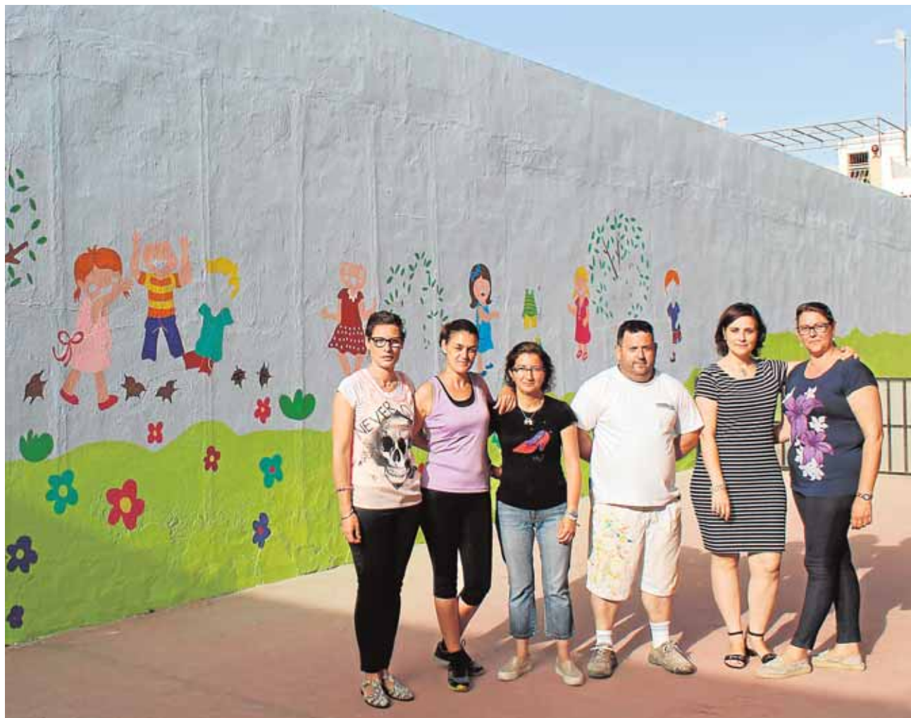
Los artistas posan con una de sus creaciones